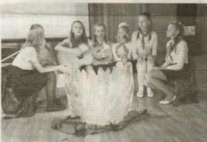
Дню Победы посвящается.